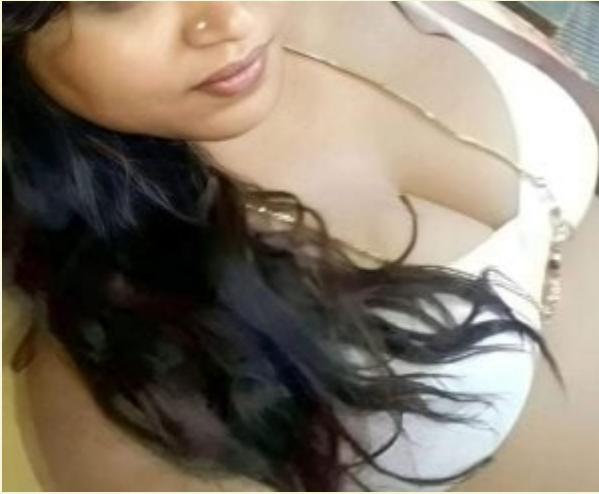
Desi Cam Sex Model Sanjana